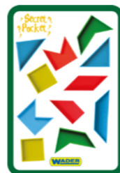
KARTA SPECJALNA = 6 PKT

Skomponuj dowolny obrazek składający się z minimum 8 elementów. Obrazek ma mieścić się w jednej z istniejących kategorii.