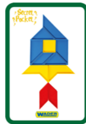
POJAZDY 1 KARTA = 2 PKT