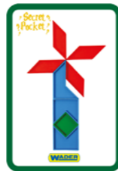
BUDOWLE 1 KARTA = 1 PKT

Mistrzem Tangramów zostaje gracz, który zdobędzie najwięcej punktów.