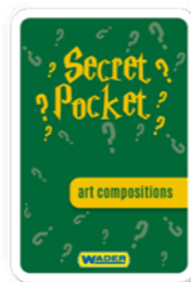
KOMPOZYCJE POP ART