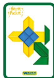
ROŚLINY 1 KARTA = 4 PKT