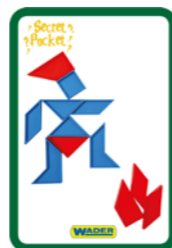
LUDZIE 1 KARTA = 5 PKT